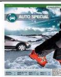
AUTO SPECIAL GÖRLITZ